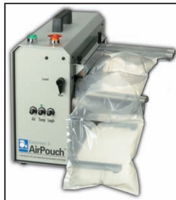
Air Pouch Void Fill System