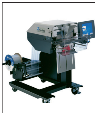
AB 180 Bagging System